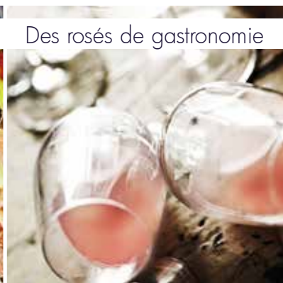
Des rosés de gastronomie