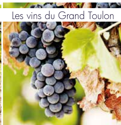
Les vins du Grand Toulon