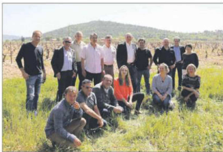
Les vignerons de l'appellation côtes-de-provence-pierrefeu présentent hier le millésime 2015 au Mas du Lingousto à Cuers.