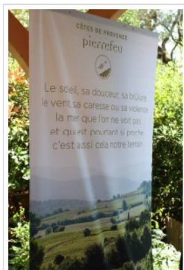
Appellation Côtes de Provence Pierrefeu

Un millésime qui a remporté 4 médailles au Concours Général Agricole de Paris : une médaille d'or pour la Cuvée Evasion du Domaine Lolicé à Puget-Ville, une médaille d'argent pour la cuvée Quintessence de la Cave de Saint-Roch les Vignes à Cuers, également l'argent pour la cuvée Régue des Botes du Domaine de Peirecèdes à Cuers, et une médaille de bronze pour la cuvée la CroixHaute des Schistes du Château Peigros à Pierrefeu.