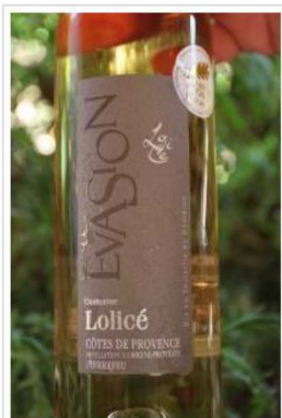
Cuvée Evasion 2015, Domaine de Lolicé à Puget-Ville