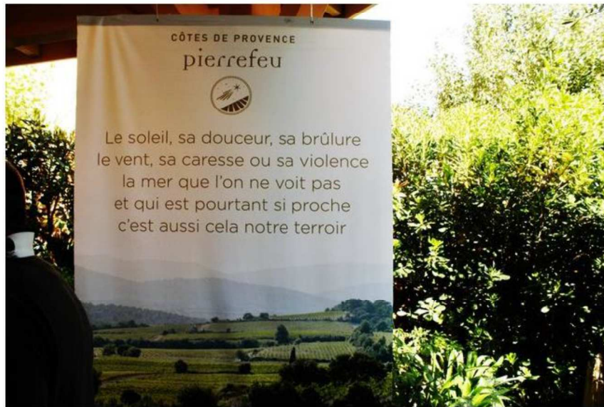
André GOFFIN, correspondant PRESSE AGENCE