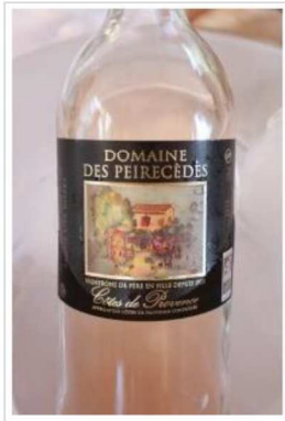
Cuvée Rogue des Botes, Domaine des Peirecèdes à Cuers