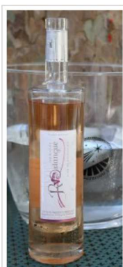
L'Or de Rostangue 2015, Domaine de Rostangue à Pierrefeu